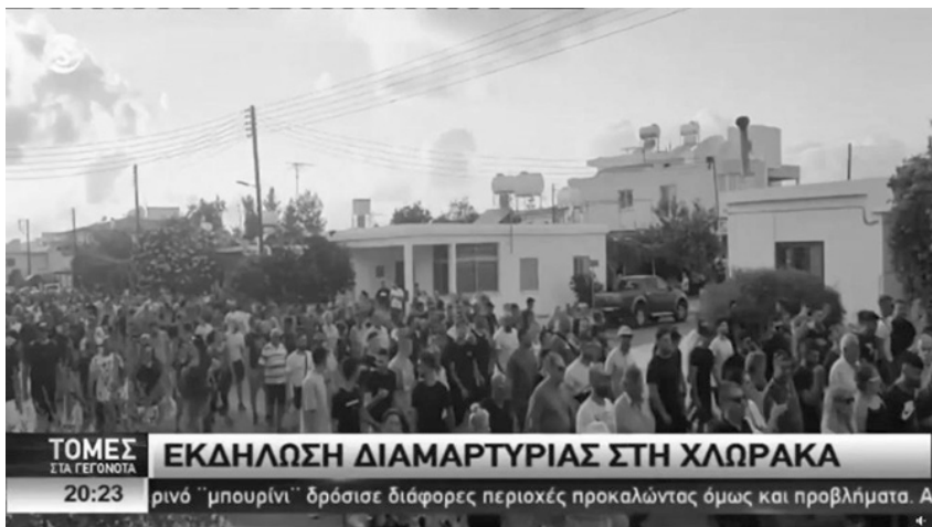
Φωτογραφία από την πορεία διαμαρτυρίας κατά των μεταναστών στην Χλώρακα

27.8.23: Στην εκδήλωση διαμαρτυρίας από τους «Επιτηρητές Χλώρακας», στήριξαν με ανοικτά καλέσματα ομάδες/σελίδες όπως η «Φωνή Λαού» και οι «Ανώνυμοι» και συμμετείχαν επίσης βουλευτές του ΕΛΑΜ, της ΕΔΕΚ και του ΔΗΣΥ. Η πορεία ήταν καλεσμένη στις 18:00 το απόγευμα στη Χλώρακα και συμμετείχαν κάπου στα 800 άτομα. Φώναζαν «έξω οι ξένοι από την Κύπρο» και σε δηλώσεις στα ΜΜΕ έλεγαν πως στόχο έχουν να αποκαταστήσουν το αίσθημα ασφάλειας που χάθηκε με τις ενέργειες των μεταναστών.